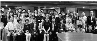
2024年7月「ホテルニューオータニ東京」