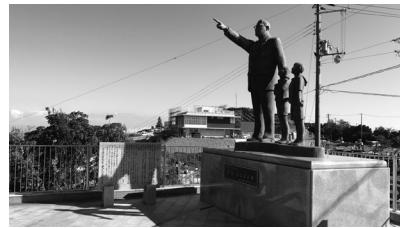
『県立公園 あわじ花さじき』