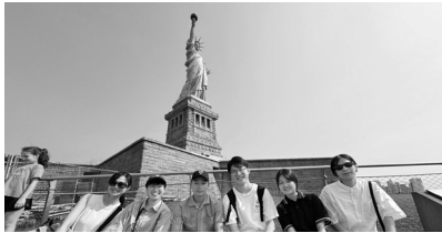
2024年7月 「自由の女神の前で」

2025年7月26日(土)から 8月1日(金) *ホームページに詳細を記載し、募集する