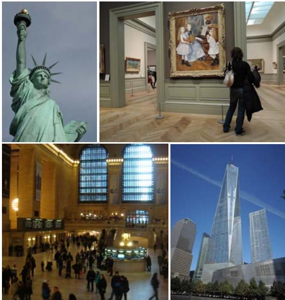
左上: 自由の女神 右上: メトロポリタン美術館 左下: グランドセントラル駅 右下: 世界貿易センタービル